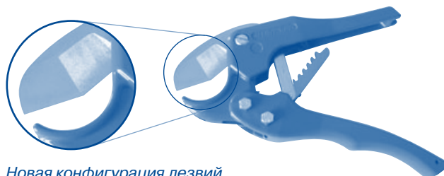
Новая конфигурация лезвий

Рекомендуем использовать новые ножницы Profi. Благодаря новой конфигурации работать с ножницами стало проще. Этими ножницами можно резать все типы труб Ekoplastik.